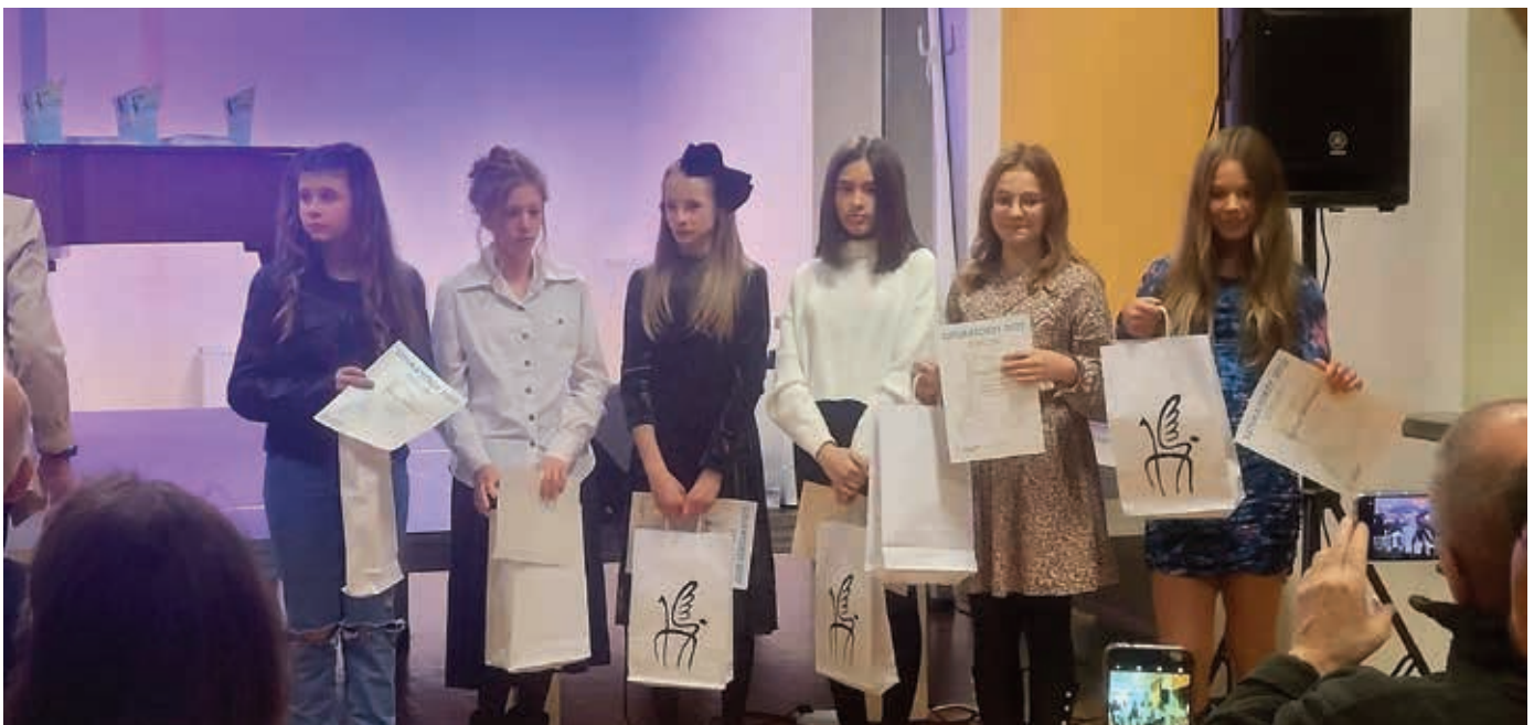
Uczestnicy - kategoria dzieci.