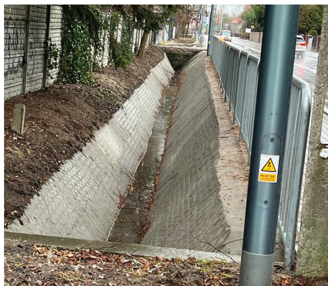
Wyremontowany rów i nowa bariera przy ul. Pionierów

Wiosny do Drogi Dzików. To rozwiązanie wnioskowane wcześniej przez mieszkańców, zdecydowanie poprawiło bezpieczeństwo pieszych na tym odcinku.