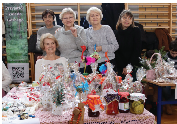
Na kiermaszu świątecznym w szkole podstawowej

Regularnie odbywały się warsztaty rękodzieła i zajęcia gimnastyczno-rehabilitacyjne. Zapraszaliśmy Gości - miały miejsce spotkania z władzami samorządowymi, spotkania z pielęgniarką, z psychologiem. Pozostajemy w stałym kontakcie z naszymi dzielnicowymi i z Komendą Powiatową Policji w ramach dbania o bezpieczeństwo seniorów.