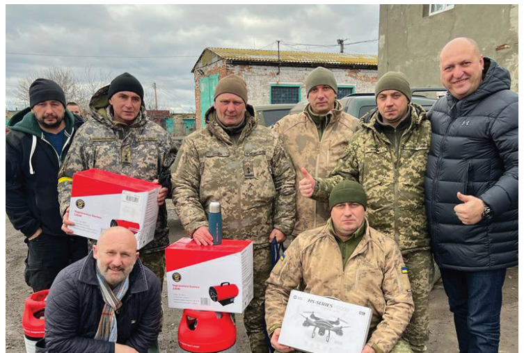
Spotkanie z żołnierzami brygady czołgów