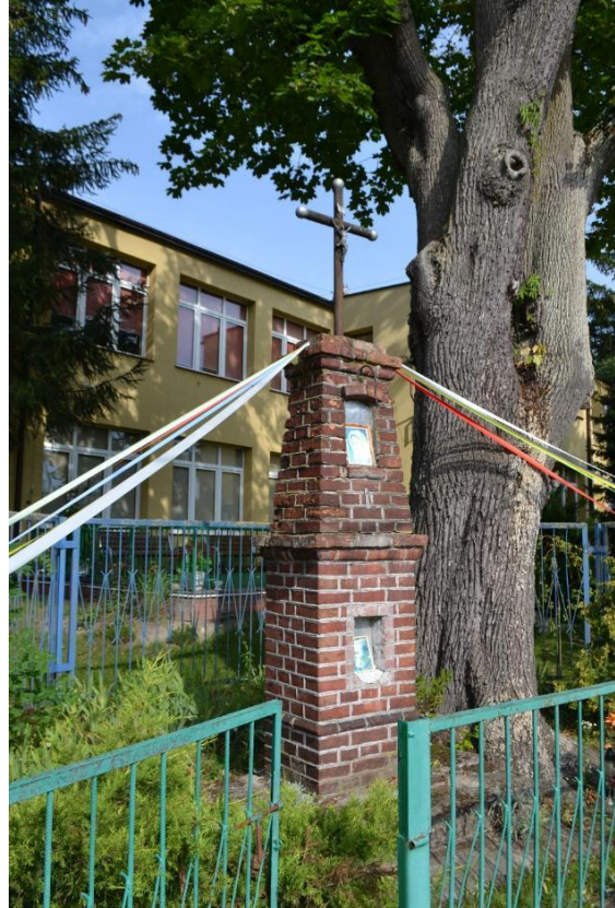
4. Stan obecny kapliczki, 2023 r.