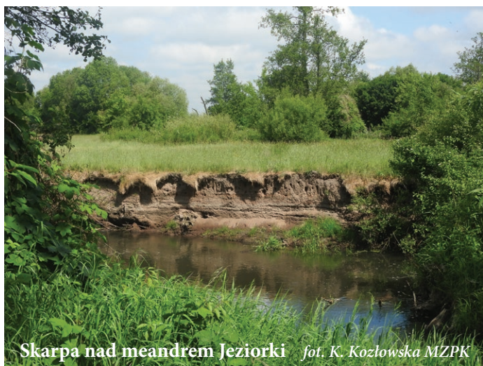
Skarpa nad meandrem Jeziorki

parku narodowego wstęp do parku krajobrazowego i poruszanie się po nim nie podlega żadnym ograniczeniom oprócz tych które obowiązują w całym kraju jak np. zakaz poruszania się samochodami po drogach leśnych, wstępu do rezerwatów przyrody poza wyznaczonymi szlakami itp.