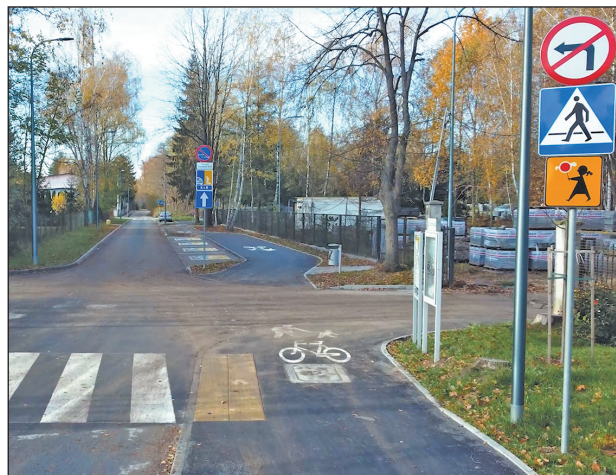
Poprawa bezpieczeństwa na ulicy Traugutta

Od 6 listopada w sąsiedztwie szkoły w Złotokłosie obowiązuje nowa organizacja ruchu. Gmina Piaseczno zakończyła inwestycję, która ma znacząco poprawić bezpieczeństwo uczniów.