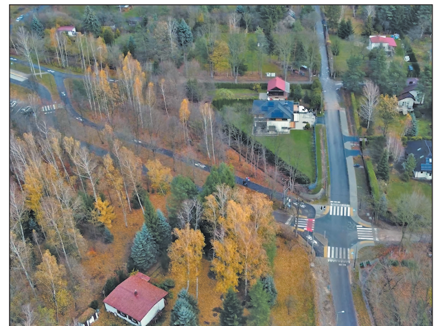
Przebudowane skrzyżowanie ulic Grójeckiej i Grottgera

Od strony ul. Runowskiej nadal obowiązuje zakaz zatrzymywania się i postoju. Kierowcy mogą korzystać z placu parkin-