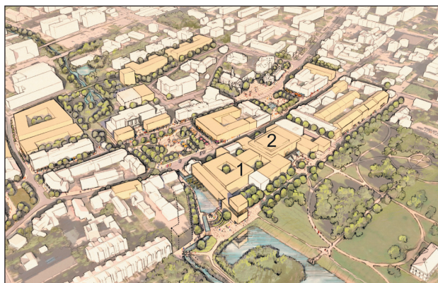
Wizualizacja nowej siedziby urzędu (1) oraz sali widowiskowej (2)

– Budowa sali widowiskowej pozwoli na organizację spektakli teatralnych, koncertów czy seansów filmowych w warunkach odpowiednich zarówno dla widzów, jak i dla artystów. Dodatkowo zależy nam na tym, by nowy obiekt wzbogacił architektonicznie centrum miasta. Ta inwestycja to duży krok w stronę rewitalizacji cen-