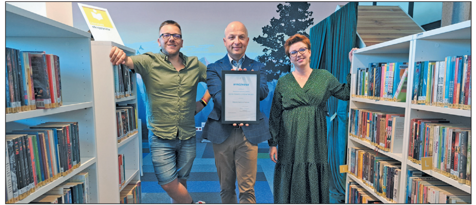
Biblioteka otrzymała wyróżnienie „Mistrz Promocji Czytelnictwa”

Wnętrza naszej biblioteki są użyczane instytucjom publicznym, stowarzyszeniom, mieszkańcom, a także firmom. W 2023 roku nieodpłatnie uży-