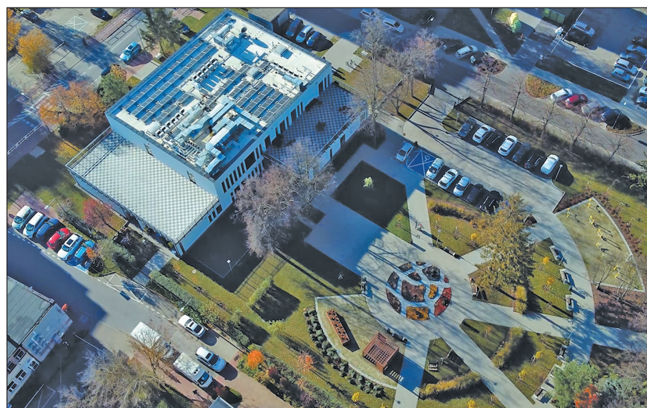
Przystań Pod Klonami