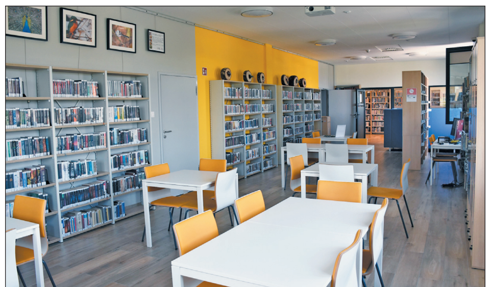
Oddział dla dorosłych głównej czytelnicy

Aktualnie sieć biblioteczna składa się z Biblioteki Głównej, 4 filii na terenie Piaseczna, 5 filii na terenie gminy oraz 2 punktów bibliotecznych. Instytucja przez ostatnich kilka lat zmieniła się i rozwijała, a placówki zyskały nowoczesnie wyposażone wnętrza i tak potrzebną dostępność architektoniczną. Placówki były odnawiane głównie ze środków z Narodowego Programu Rozwoju Czytelnictwa 2.0, Priorytet 2 „Infrastruktury bibliotek 2016–2020” i „Infrastruktury bibliotek 2021–2025”. W latach 2021–2023 miała miejsce kompleksowa modernizacja parteru budynku biblioteki i Domu Kultury przy ul. Kościuszki 49 oraz wyposażenie filii w Przystani Pod Klonami przy ul. Szkolnej 18. Od marca 2023 roku czytelnicy mają możliwość korzystania z nowej placówki bibliotecznej w Gołkowie-Letnisku przy ul. Głównej. Filia jest tzw. MALiB – Miejscem Aktywności Lokalnej i Bibliotecznej, gdzie wraz z Miejsko-Gminnym Ośrodkiem Pomocy Społecznej tworzymy przyja-