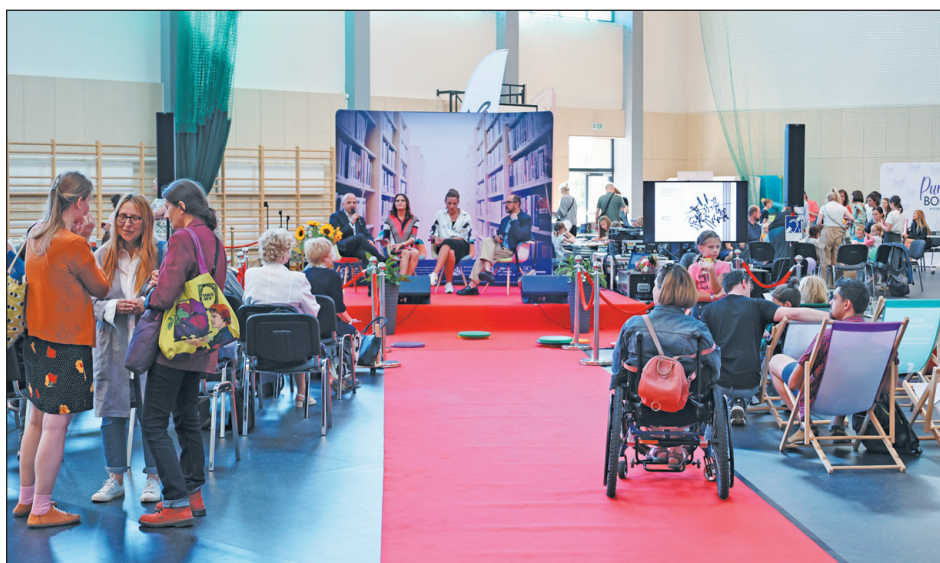
Wystąpienia w trakcie Festiwalu Pięknej Książki w Piasecznie