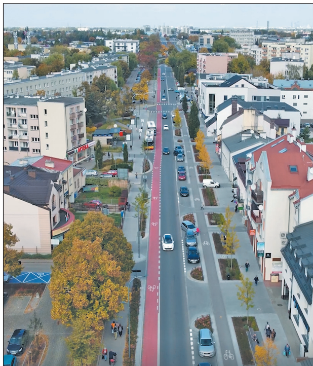
Ulica Puławska w Piasecznie

Wraz z powiatem opracowaliśmy także projekt przebudowy skrzyżowania ulic Okulickiego i Wojska Polskiego, by poprawić bezpieczeństwo i ułatwić pokonanie skrzyżowania dróg krajowej, wojewódzkiej i powiatowej. Liczymy na to, że inwestycję tę zrealizuje w najbliższym czasie MZDW w porozumieniu z Generalną Dyрекcją Dróg Krajowych i Autostrad. Z zarządcą biegnącej przez gminę Piaseczno drogi krajowej nr 79 gmina również współpracowała w ostatniej kadencji – przede wszystkim zgłaszając swoje uwagi i sugestie odnośnie do projektowanej przebudowy DK79 na odcinku od Piaseczna do obwodnicy Góry Kalwarii. Zrealizowaną w latach 2021–2022 przez GDDKiA rozbudowę ul. Puławskiej o trzeci pas ruchu dla każdego kierunku na odcinku między ulicami Syrenki i Energetyczną poprzedziło przygotowanie i sfinansowanie projektu tej inwestycji przez gminę Piaseczno. Kolejnym zarządcą dróg na naszym terenie, z którym współpracujemy, jest Mazowiecki Zarząd Dróg Wojewódzkich. Gmina Piaseczno dofinansowała przygotowanie