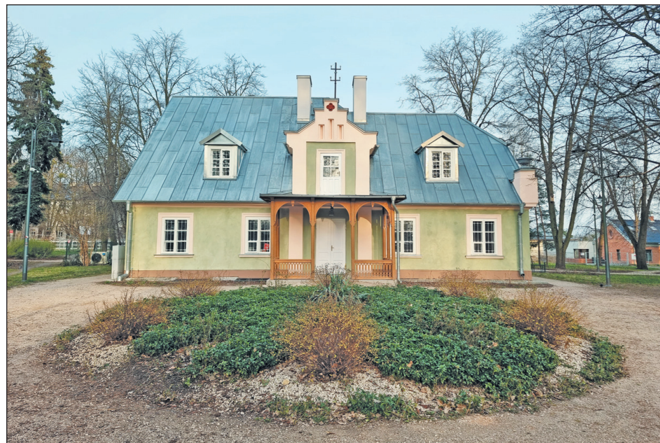
„Poniatówka”, filia Muzeum Piaseczna

Oczywiście w mijającej kadencji realizowane były także inwestycje oświatowe. W 2019 roku zakończyła się budowa najnowocześniejszego jak dotąd obiektu w naszej gminie – Centrum Edukacyjno-Multimedialnego, w którym działają Szkoła Podstawowa nr 4 oraz Biblioteka Publiczna w Piasecznie. Szkoła Podstawowa im. Tade-