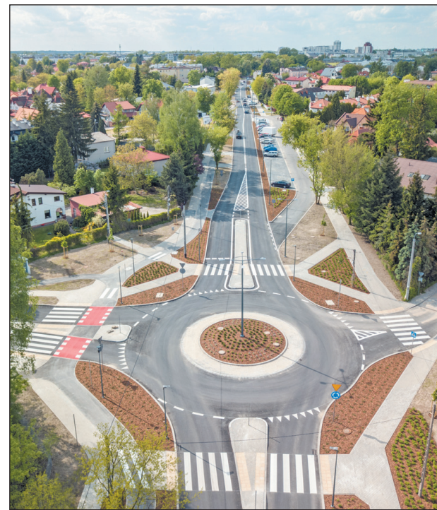
Ulica Księcia Janusza I Starego w Piasecznie