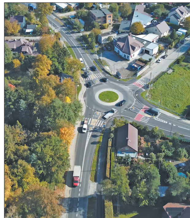
Ulica Pod Bateriami w Piasecznie