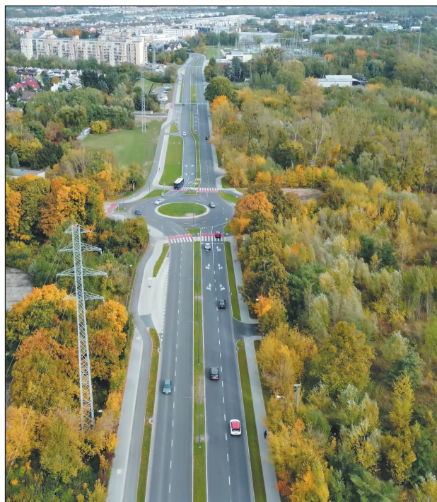
Ulica Energetyczna w Piasecznie

Gmina Piaseczno przygotowała też dokumentację projektową dla kilkadziesiątu kolejnych inwestycji. Po uzyskaniu niezbędnych pozwoleń i zabezpieczeniu środków budżetowych będzie możliwe ogłoszenie przetargu na ich realizację.