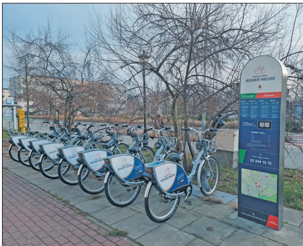
Stacja rowerowa przy ul. Kościuszki w Piasecznie

Od kilku lat konsekwentnie realizowana jest też wymiana oświetlenia drogowego na energooszczędne. W 2023 r. rozpoczęła się wymiana ostatniego tysiąca lamp rtęciowych na ledowe. Tam, gdzie już od lat świecą lampy sodowe, również w miarę możliwości