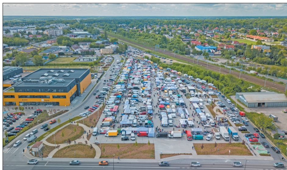
Targowisko miejskie w Piasecznie

Na szkolne i przedszkolne inwestycje gmina Piaseczno wydała w ostatnich pięciu latach łącznie ponad 47 mln zł.