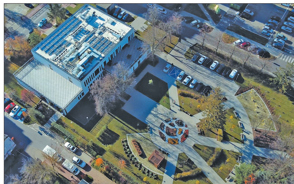
Przystań Pod Klonami – Centrum Aktywności Seniora w Piasecznie