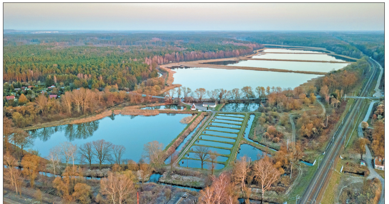
Stawy hodowlane w Żabieńcu / Lasy Chojnowskie

Tereny zielone wpływają pozytywnie nie tylko na jakość powietrza, lecz również na komfort życia mieszkańców. A dodatkowo pełnią istotną rolę w gospodarowaniu wodami opadowymi. W tej kadencji przygotowane zostało opracowanie, w którym analizie poddany został cały system odwodnieniowy istniejący na terenie naszej gminy. W oparciu o nie stworzono model, który jest punktem wyjścia do realizacji programu ochrony przeciwpowodziowej. Realizacja tego programu wymaga oczywiście sporych nakładów finansowych oraz gotowości do współpracy Wód Polskich, zarządców innych elementów sieci odwodnieniowej, w tym sąsiednich gmin, prywatnych inwestorów czy samych mieszkańców – ale pierwsze działania w tym zakresie już zostały podjęte. Uzupełnieniem działań związanych z tworzeniem efektywnego gospodarowania wodami opadowymi jest system kanalizacji deszczowej i zbiorników retencyjnych, budowany wraz z infrastrukturą drogową. Wszędzie tam, gdzie to możliwe, staramy się tworzyć retencję wody za pomocą błękitno-zielonej infrastruktury. Są to otwarte rowy i tereny przeznaczone pod zalanie wodą, pokryte odpowiednimi nasadzeniami, jak np. tereny przylegające do Kanału Piaseczyńskiego.