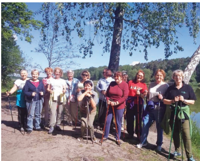
Fot. Agnieszka Sierpińska