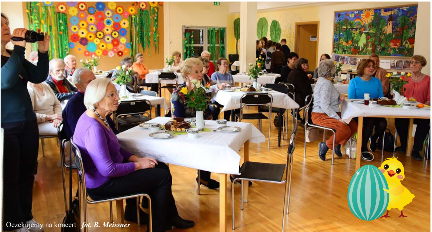
Oczekujemy na koncert