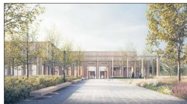
Wizualizacja Projekt P2PA

W przetargu na budowę nowego basenu wpłynęło sześć ofert. Ze względu na odwołania procedura rozstrzygnięcia przetargu trwała kilka miesięcy, ale są szanse na podpisanie umowy z wykonawcą jeszcze w grudniu.