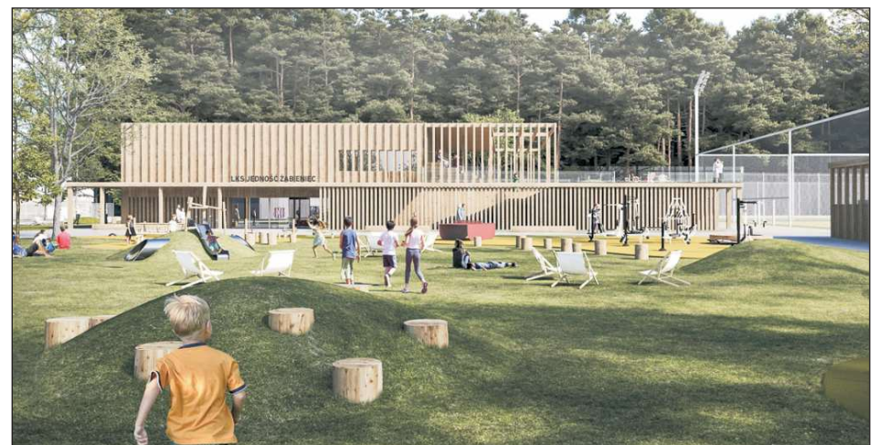
Wizualizacja świetlicy sportowej w Żabieńcu

Piaseczno może się pochwalić najbardziej rozbudowaną ofertą transportu publicznego wśród gmin podwarszawskich. Koszty utrzymania linii autobusowych oraz połączeń kolejowych, w tym