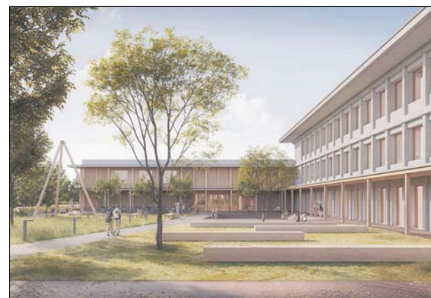
Wizualizacja szkoły w Julianowie

– Mam dużą satysfakcję, że tak szybko udało nam się przeprowadzić procedurę – we wrześniu otrzymaliśmy świetnie przygotowany wniosek o dofinansowanie, a już w grudniu zapadła decyzja