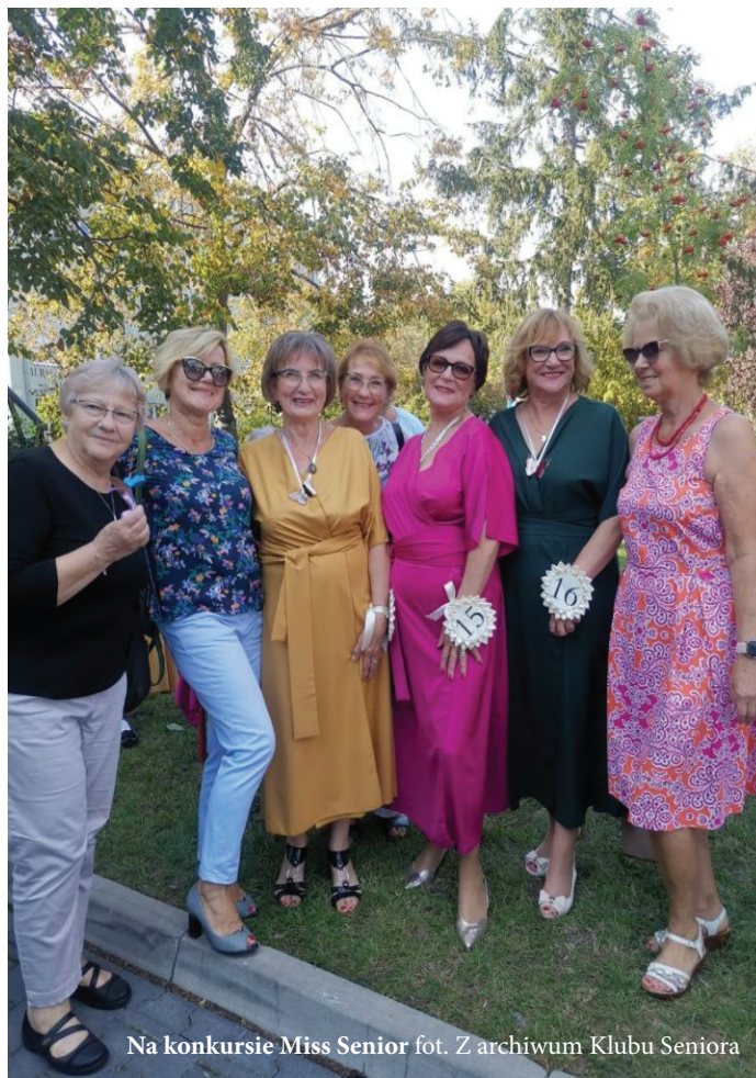
Na konkursie Miss Senior