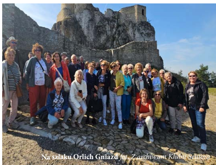
Na szlaku Orlich Gniazd