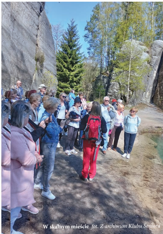
W skalnym mieście