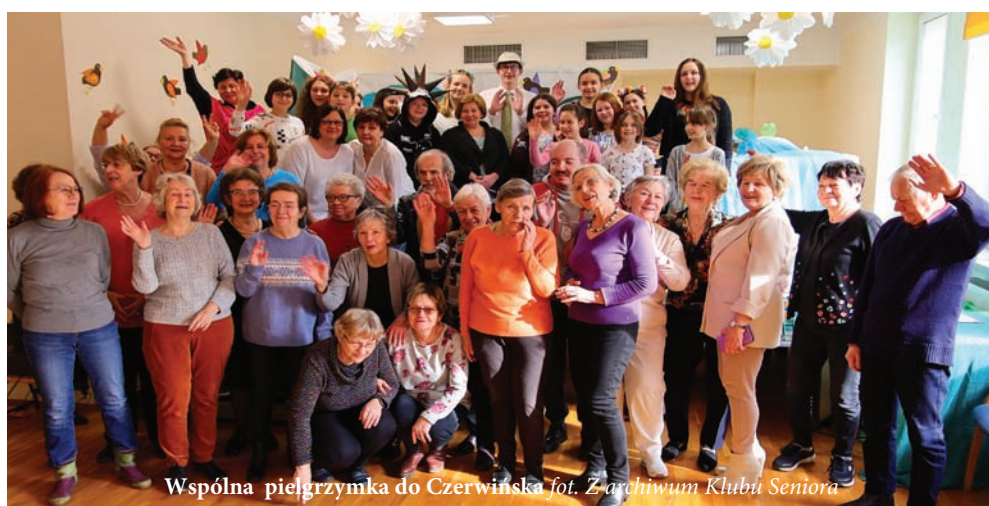
Wspólna pielgrzymka do Czerwińska