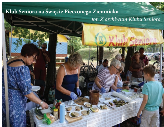
Klub Seniora na Święcie Pieczonego Ziemniaka