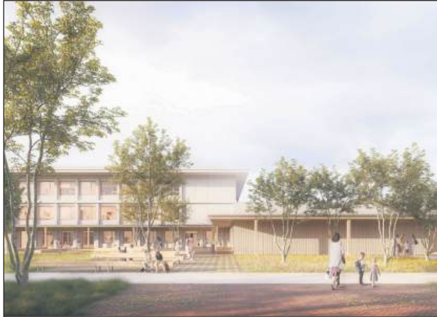
Wizualizacja szkoły w Julianowie

Krajowa Izba Odwoławcza zdecydowała o utrzymaniu w mocy rozstrzygnięcia przetargu na budowę szkoły w Julianowie. To otworzyło drogę do podpisania umowy z wyłonionym w przetargu wykonawcą, który przystąpi do wykonania dokumentacji technicznej, a następnie budowy szkoły.