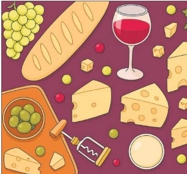
Grafika Freepik.com i modyfikacja ChatGPT

Po raz pierwszy w Piasecznie wyjątkowa impreza. Uczcijmy wspólnie Noc Muzeów z wybornymi serami i winami.